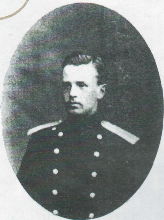
Михаил Осоргин, Гродненский губернатор

ню горла и прислал мне любезную записку, прося после заседания его навестить. Так как его имение было всего в нескольких верстах от города, я после съезда, который прошёл довольно вяло, отправился к нему. Каково же было моё удивление застать его почти совершенно здоровым... Это было до того бестактно, что как только встал из-за стола (звал он меня обедать), я немедленно уехал, унося из этого посещения тяжёлое впечатление от неумения ... держаться с достоинством. И этого-то Вышеславцева впоследствии Мирский навязал мне в губернские предводители дворянства».