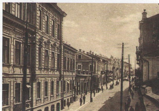
Здание окружного суда в Гродно на ул. Советской