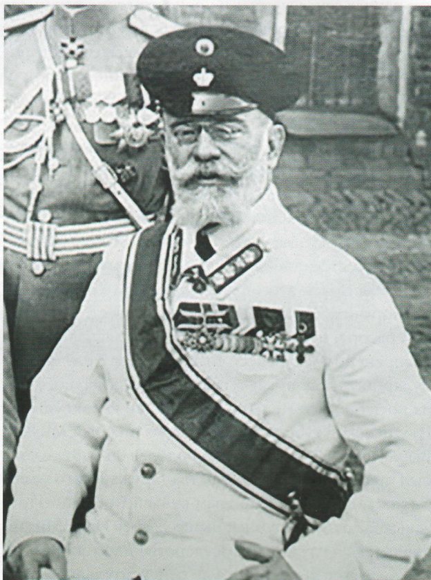
Портрет тайного советника