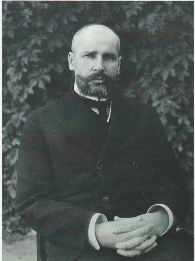
Пётр Столыпин, Гродненский губернатор

«В этот день он (П.А. Столыпин) присутствовал на юбилейном праздновании инспектора народных училищ